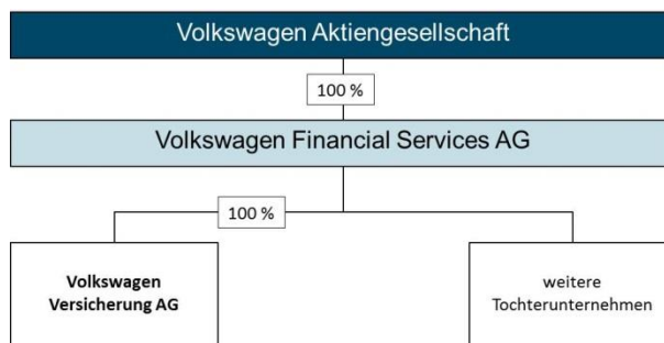
ABBILDUNG 1: ORGANISATORISCHE EINBINDUNG DER VOLKSWAGEN VERSICHERUNG AG

Im Rahmen der Erstversicherung betreibt die Volkswagen Versicherung AG Versicherungsgeschäft im Geschäftsbereich sonstige Kraftfahrtversicherung (Garantie- und Reparaturkostenversicherung) in den Märkten Deutschland, Frankreich, Irland, Italien, Österreich, Polen, Schweden, Spanien und Tschechien. Das Erstversicherungsgeschäft wurde im Berichtszeitraum teilweise über die französische Niederlassung per grenzüberschreitendem Dienstleistungsverkehr gezeichnet.